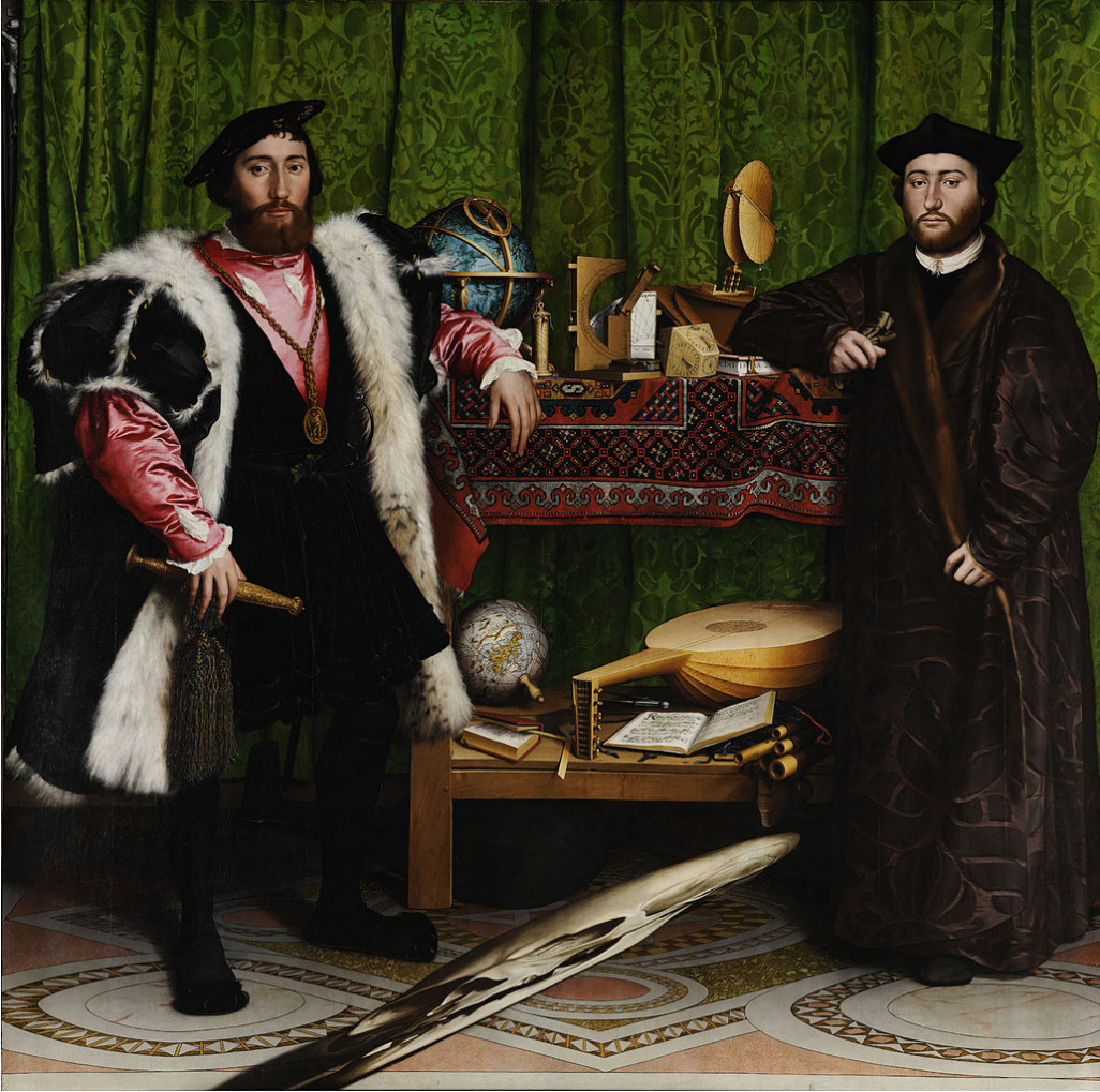
Hans Holbein, The Ambassadors (Büyükelçiler) , 1533.

You are allowed to use phone or computer-based translation for this assignment. If you do, please send the results to: ddrapak@gnspes.ca .