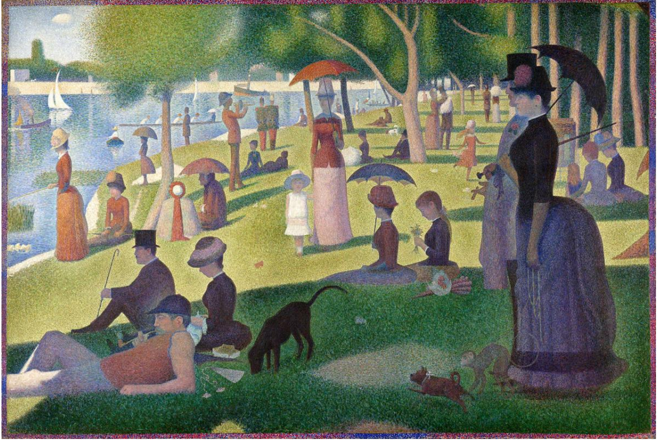
Georges-Pierre Seurat, A Sunday Afternoon on the Island of La Grande Jatte (La Grande Jatte Adası'nda Bir Pazar Öğleden Sonrası), 1884–1886.

You are allowed to use phone or computer-based translation for this assignment. If you do, please send the results to: ddrapak@gnspe.ca .