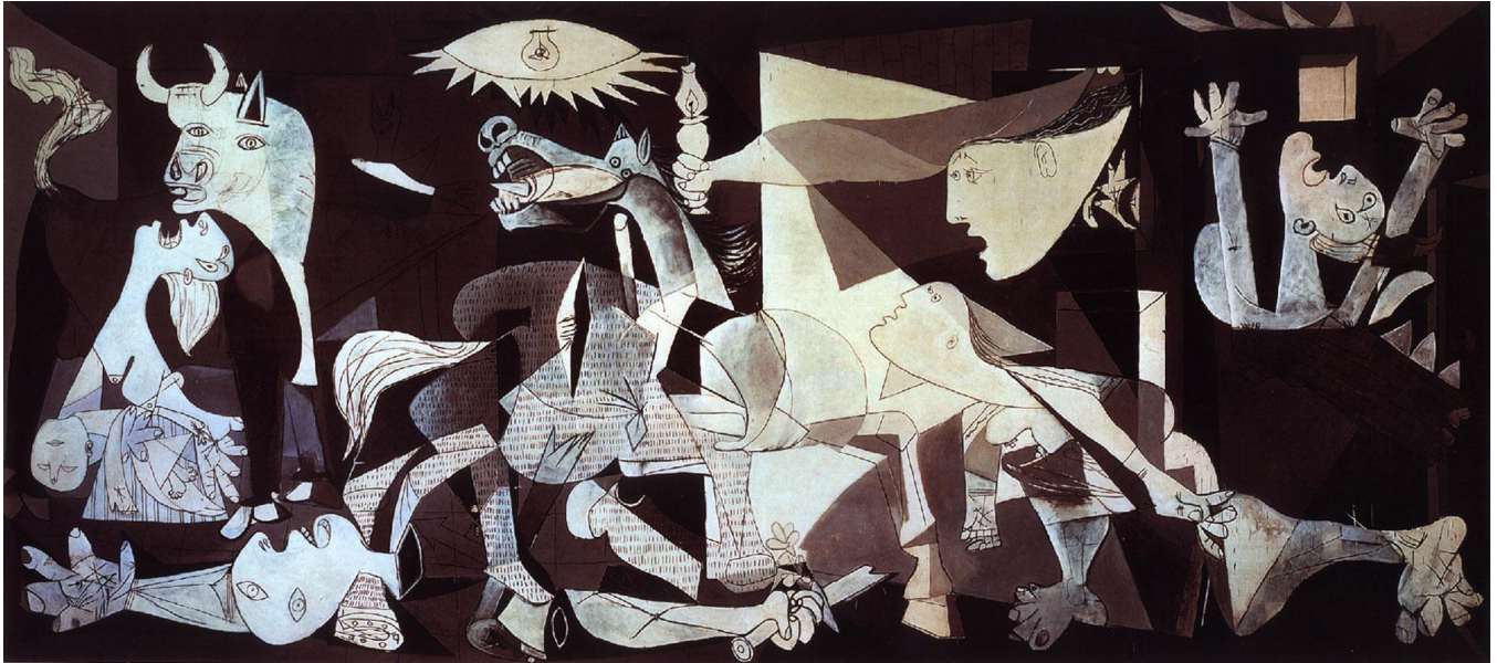
Pablo Picasso, Guernica , 1937

When this painting was made, most people would have been aware that the small Spanish village of Guernica was bombed by Italian and German warplanes. The Pro-Fascist Spanish government believed the village contained anti-Fascist rebels, and asked Italy and Germany to help fight.